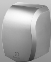
сушилки для рук